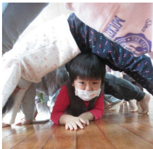
努力鑽過身體山洞

另外在小組中孩子曾提到選擇洞洞組是因為「可以躲在洞裡很像在帳篷或秘密基地…」，我們約定好找時間來體驗一下睡在洞洞裡的感覺，因此挑了一天中午大家合作把紙箱用椅子固定擺放好，各自選擇一個想要的紙箱帳篷躲進去，光是在裏頭來來回回移動鋪棉被就夠開心了，等一切就緒準備休息時，看上去有那麼點像膠囊旅館，且好幾個孩子還不忘精心佈置一下自己的床位，蓋上棉被當作門口、放上娃娃裝飾…畫面還真逗趣，一覺醒來孩子們議論紛紛這特別的午睡經驗：「裡面有點黑、有一點熱熱的、好好玩！」這樣的隱蔽空間帶給孩子莫大的安全感及滿足感，也讓孩子的身體對空間有更多的感受。