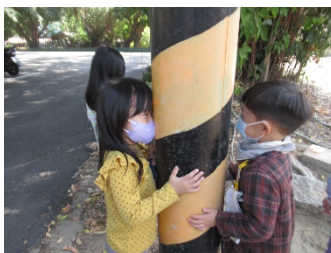
從電線杆的洞洞看真好玩