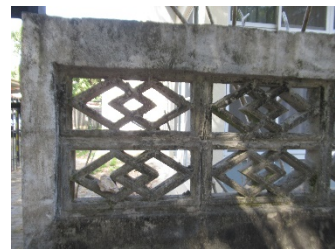
我們發現圍牆、窗戶的鏤空設計