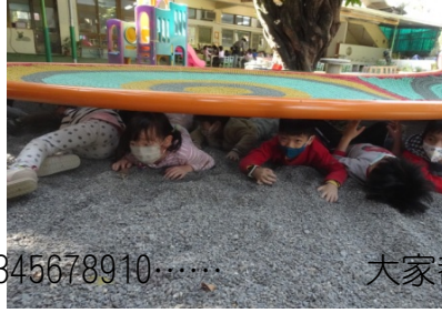
大家都躲到哪裡去了。