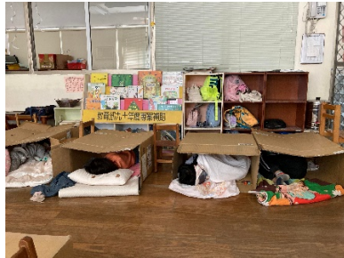
開心的睡在紙箱帳篷裡