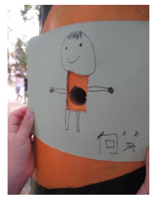
試著進去大家合作挖的洞裡看看有多深