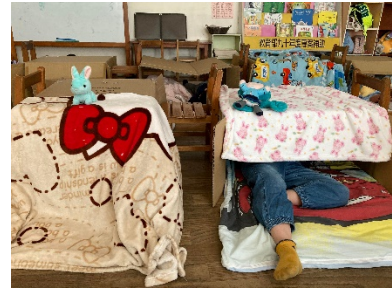
精心佈置的紙箱小屋